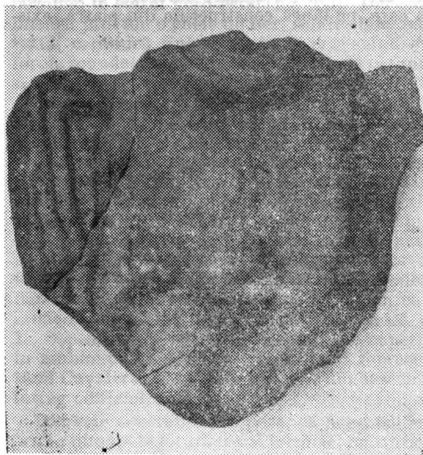
Fig. 3. Felmer. Fragment din monumentul roman.

Din descrierea complexelor a rezultat că una din locuințe este de tip bordei (deteriorată în prezent atât de mult la partea superioară încât poate fi considerată semibordei), în timp ce celelalte două sunt construite la suprafață. Acest din urmă fapt, conjugat cu constatarea că